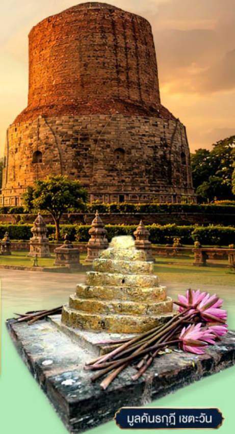
มุลคันรฤฎี เขตตะวัน