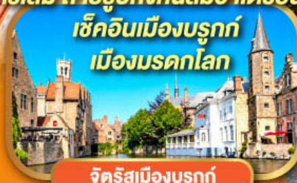
จัตุรัสเมืองบรูจ