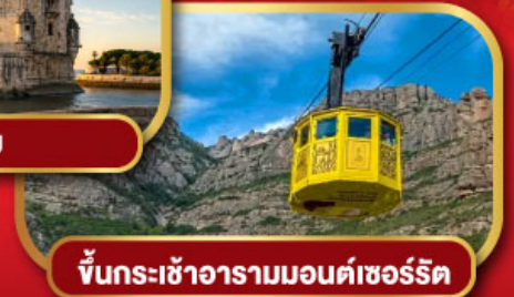
ขึ้นกระเช้าอารามมอนต์เซอรัลิต