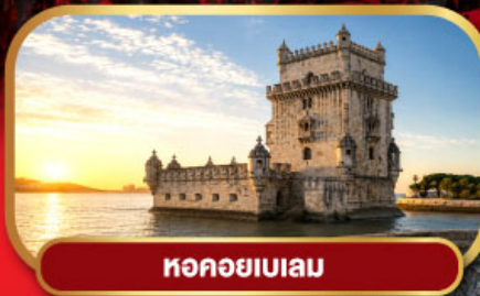
หอคอยเบเลม