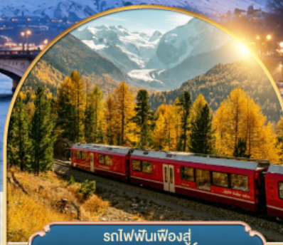
รถไฟฟันเฟืองสู่ยอดเขากรอนเนอริเกรต