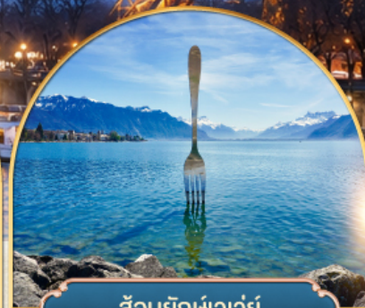
ล้อมยักซ์เวเวย์