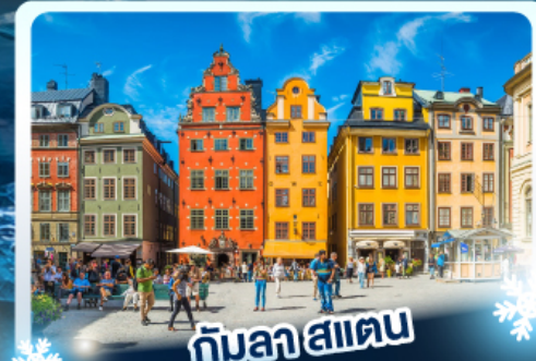
🏰 กับลา สแตน