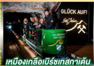
เหมืองเกลือเบิร์ชเทสกาเดิน