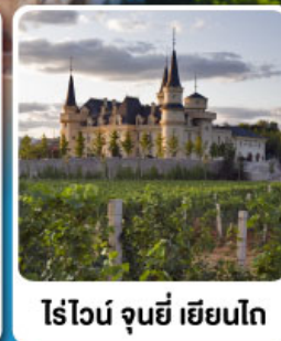
ไร่ไวน์ จุนยี่ เยียนไถ่