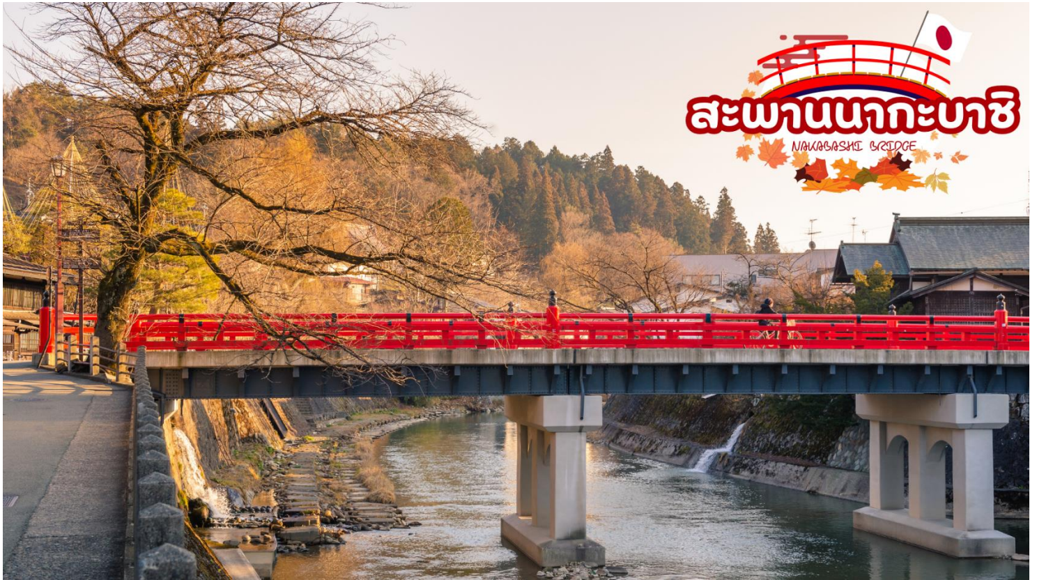
สะพานนากะบาชิ (Nakabashi Bridge) สะพานสีแดงของย่านเมืองเก่า สะพานทอดข้ามแม่น้ำมิกากาวะที่ไหลผ่านใจกลางเมือง สะพานแห่งนี้ถือเป็นสัญลักษณ์ของเมืองทาคายามา

เมืองเก่าทาคายามา (Takayama Old town) หรือ ถนนชั้นมาจิซุจิ ซึ่งเป็นหมู่บ้านเก่าแก่สมัยเอโดะกว่า 300 ปีก่อน ที่ยังอนุรักษ์และคงสภาพเดิมได้เป็นอย่างดี อีสระให้ทุกท่านได้เดินเที่ยวและชื่นชมกับทัศนียภาพเมืองเก่าซึ่งเต็มไปด้วยบ้านเรือนโบราณ และร้านค้าหลากหลาย เช่น ร้านอาหาร ร้านขายของที่ระลึก ร้านงานศิลปะ