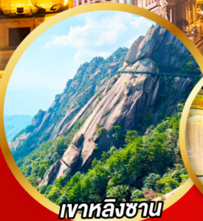
เขาล้างจาน