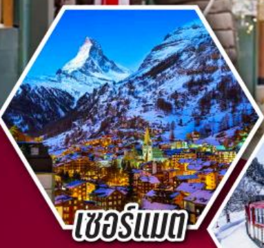
เซอร์แมท