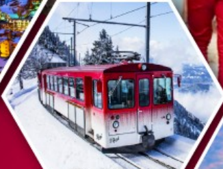
รถไฟใต้เขาริกิ