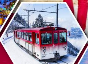
รถไฟใต้เขาริกิ