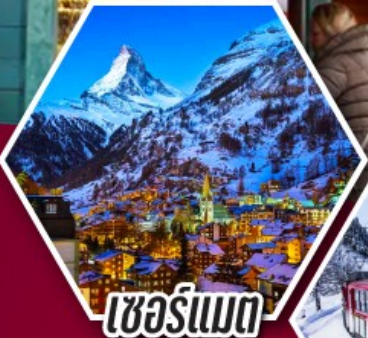
เชอร์แมต