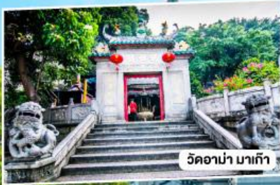
วัดอามาเก๊า