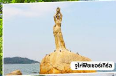
จูไห่ฟิชเชอร์เกิร์ล