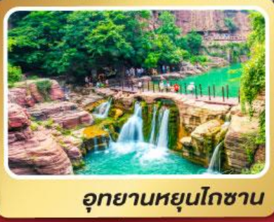
อุทยานหยุ่นโกซ่าน