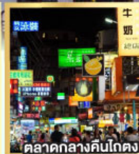
ตลาดกลางคืนโตง