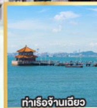
ทำเรือจั้นเฉียว