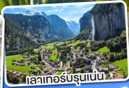
เลาเกอร์บรุนเนน

เดินทาง 12-18 มี.ค. 68 28 มี.ค.-03 เม.ย. 68 10-16 เม.ย. 68 29 เม.ย.-05 พ.ค. 68