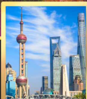
เซี่ยงไฮ้