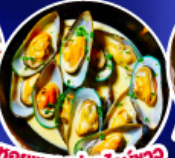
hoy meng goo หน่อหน้าว