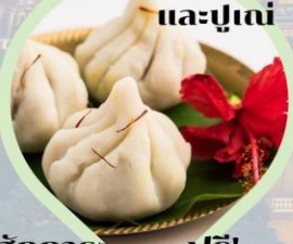
รับชุดลักการะ ฟรี! ท่านละ 1 ชุด