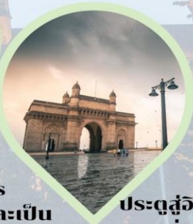
ประตูสู่อินเดีย (Gateway of India) อ่าวมุมไบ Arabian Sea