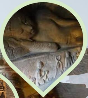
ชมมถ้ำพระพุทธรูป เทวสถานอชันต้า