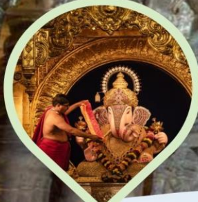
สักการะองค์พระพิฆเนศวร ศักดิ์สิทธิ์ประจำเมืองมุมไบ และปูणे