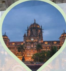
ชม Victoria Terminus สถานีรถไฟประวัติศาสตร์และเป็น มรดกโลกของยูเนสโก