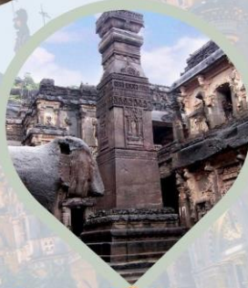
มถ้ำศรัยถ้ำไทรลา ไฮไลท์ ถ้ำ เอลโลร่า