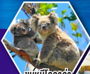
ชมหมีโคอาล่า ณ สวนสัตว์ซิดนีย์