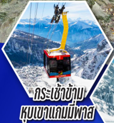
กระเช้าข้าม หุบเขาแคมมีพาส