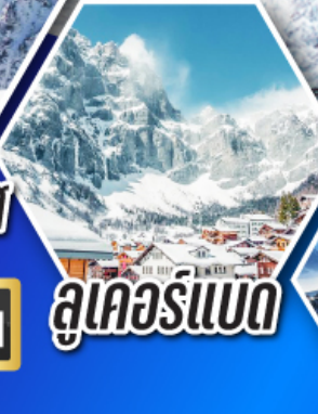
ลูคอร์เนอ