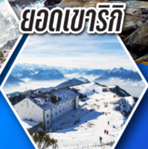
ยอดเขาริก

ชมมหาธารน้ำแข็งยักษ์ อาเลซ กลาเซียร์ แห่งยอดเขาออกกิสฮอร์น ราคาเริ่มต้น