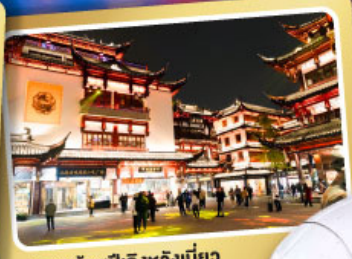
ตลาดร้อยปีเฉิงหวงเหมียว