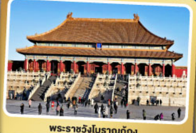
พระราชวังโบราณปักกิ่ง