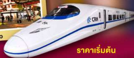
ราคาเริ่มต้น