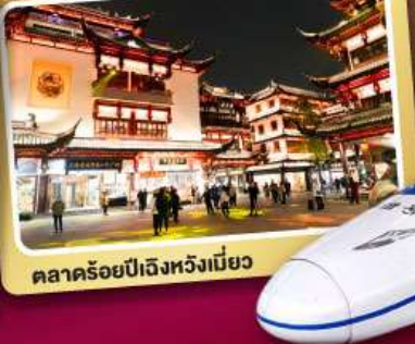
ตลาดร้อยปีเจิ้งหวิงเมี่ยว