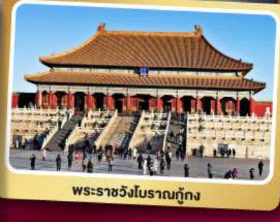
พระราชวังโบราณกู้กง