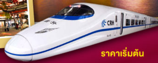
ราคาเริ่มต้น