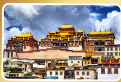
วัดลามะซงจ้านหลิง