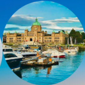
Victoria, British Columbia (Canada)