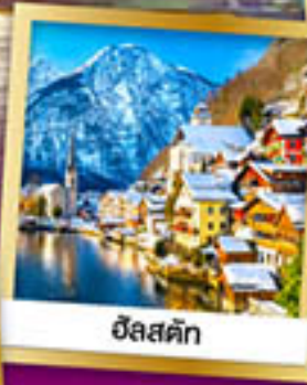
ฮิลส์ตัท