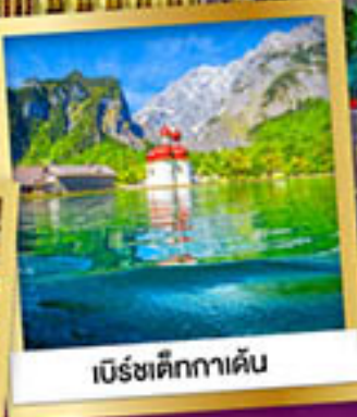
เบียร์ชเต็ทกาเดิน