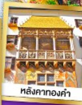
หลังคาทองคำ