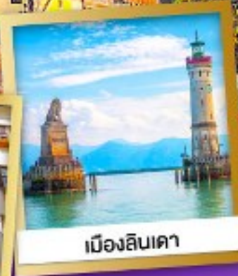
เมืองลินเคา