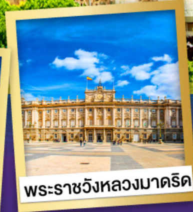
พระราชวังหลวงมาดริด