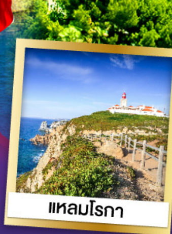
แหลมโรกา