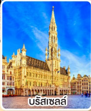
บรีซาเซล