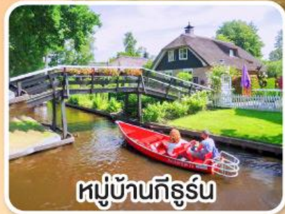
หมู่บ้านทีร์ูร์น