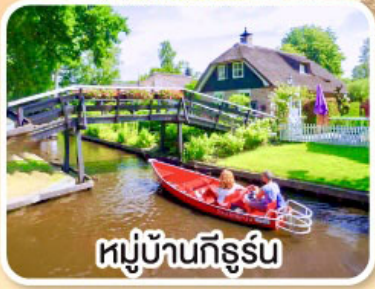
หมู่บ้านทึร์รัน