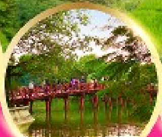
ทะเลสาบคืนศาน