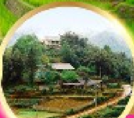
หมู่บ้านก๊อตก๊ต