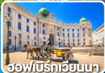
ฮอฟบิรท์เวียนนา