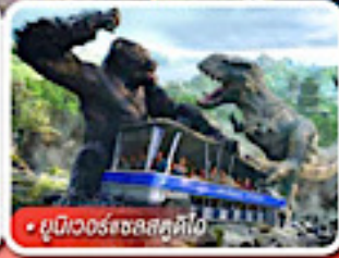
ยูนิเวอร์แซลส์ตูดิโอ