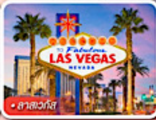
ลาสเวกัส