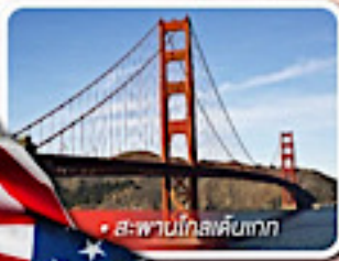
สะพานโกลเด้นเกต