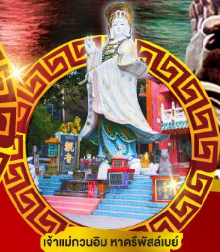
เจ้าแม่กวนอิม หาดริฟส์สีย์