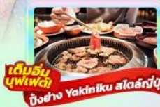
เดิมนมบุฟเฟ่ต์ ปิ้งย่าง Yakiniku สดร้อนๆ

22-26 พ.ค. 69 / 29 พ.ค.-02 มิ.ย. 69 17-21 มิ.ย. 69 / 26-30 มิ.ย. 69