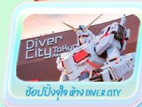
ช้อปปิ้งจุใจ แห่ง DIVER CITY