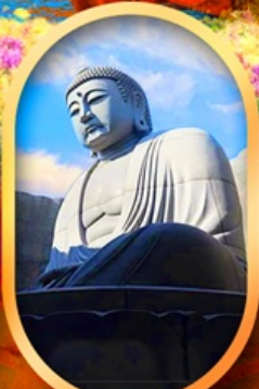
เบ็นเนาแห่งพระพุทธรเจ้า