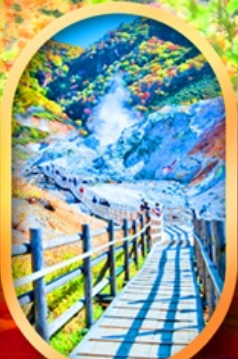
หุบเขานรกจิดอกดาบิ