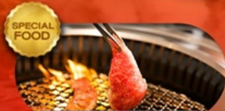
อาหารมือพิเศษ ปิ้งย่างยากิniku