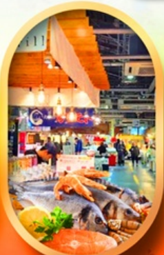
ตลาดปลานิวโตะ