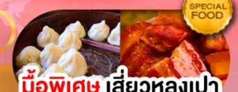
มือพิเศษ เสี่ยวหลงเปา หมูตงพอ ซิโครงหมู เดินทาง ม.ค. - มี.ค. 69