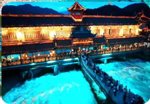
เมืองโบราณตุเจียงเหียน