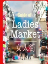
Guide of Ladies Market 女人街