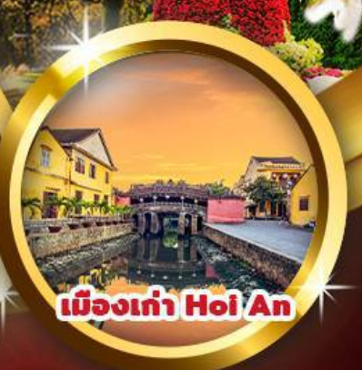
เมืองเก่า Hoi An

“นั่งกระเช้าที่ยาวที่สุดในโลก ล่องเรือกระดิ่งชมวิถีหมู่บ้านกิมทาน สู่เมืองบานาฮิลล์ ชมวิวสะพานมือสีทอง เมืองมรดกโลกฮอยอัน”