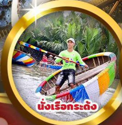
นั่งเรือกระดิ่ง