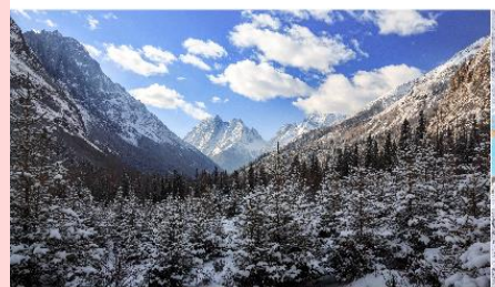
ภูเขาสี่ดรุณี