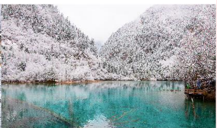
อุทยานแห่งชาติจิวจ้ายโกว