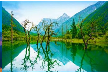
หุบเขาชวงเฉียวโกว