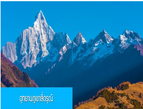
อุทยานภูเขาสี่ดรุณี

หลังอาหารนำท่านเที่ยวชม หุบเขาชวงเฉียวโกว 双桥沟景区 ที่เป็นแหล่งท่องเที่ยวที่สวยงามที่สุดแห่งหนึ่งในเขตอุทยานภูเขาสี่ดรุณี นำท่านนั่งรถบัสของอุทยานที่วิ่งไปผ่านเส้นทางที่สร้างคู่ขนานกับลำธารกษยในหุบเขา ท่านจะได้สัมผัสกับความสวยงามของทัศนียภาพธรรมชาติที่หาชมได้ยาก โดยมีภูเขาหิมะสูงตระหง่านอยู่เบื้องหลัง ธารน้ำใสไหลริน และสระน้ำที่มีสีเขียวมรกต ในฤดูใบไม้ผลิและฤดูร้อนท่านจะได้เห็นฝูงจามรีท่ามกลางทุ่งหญ้าเขียวขจี ส่วนในฤดูหนาวทุ่งหญ้าและพื้นดินจะปกคลุมด้วยพรมหิมะสีขาว....รถบัสของอุทยานจะนำนักท่องเที่ยวไปยังจุดชมวิวสำคัญต่าง ๆ ภายในเขตอุทยาน เพื่อให้นักท่องเที่ยวได้เที่ยวชมสถานที่และถ่ายรูปไปตามอัธยาศัย จนครบแ่เวลา นำคณะขึ้นรถบัสออกจากอุทยาน