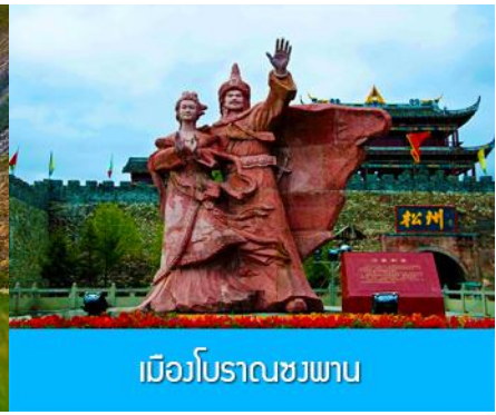
เมืองโบราณซงพาน