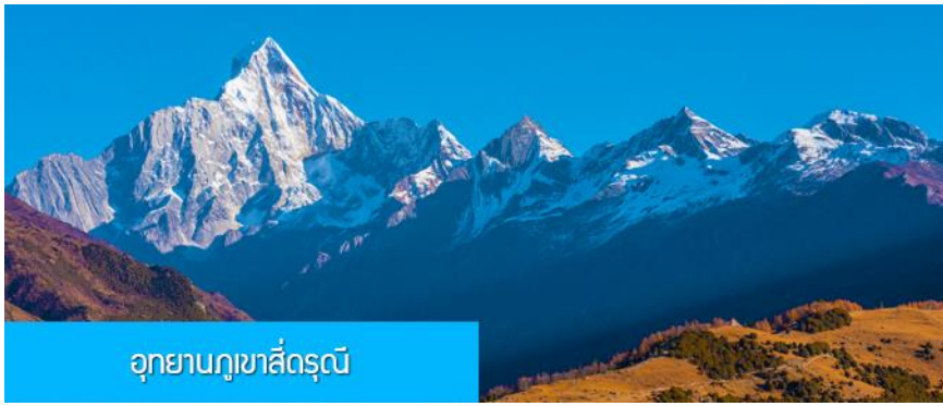
อุทยานภูเขาสี่ดรุณี