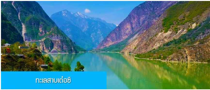
ทะเลสาบเต๋อซี