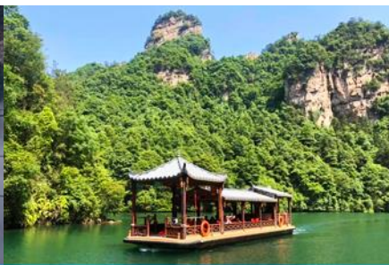
ล่องเรือทะเลสาบ เป้าเฟิงหู

วันที่ห้า ชมพระอาทิตย์ขึ้น-เขาเทียนจื่อซาน(อวตาร) นั่งกระเช้าลงจากเขา-เมืองจางเจียเจี๋ย – เลือกซื้อโปรแกรมทัวร์เสริม ออฟชั่น สะพานกระจกข้ามหุบเขาแกรนด์แคนยอน-เดินทางกลับเมืองหยี่ชัง