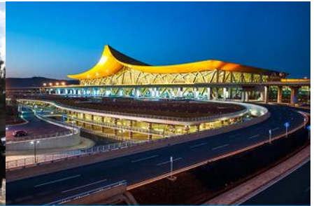
สนามบินเมืองคุนหมิง