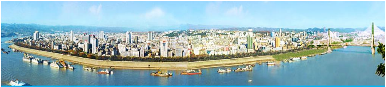
เมืองหยีฉาง

- เที่ยวเต็มสุข ไม่ต้องเร่งรีบเข้าร้านช้อปปิ้งบังคับ - บินกลางวัน ไม่อดนอนเหมือนเที่ยวบินกลางคืน - โปร่งใสน่าเชื่อถือ ไม่มีค่าใช้จ่ายซ่อนเร้น - ไม่เก็บทิปก่อนเที่ยว เพราะมั่นใจในคุณภาพ