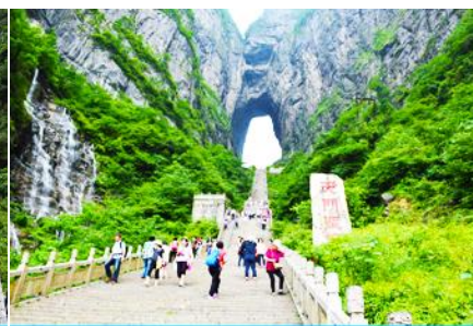
บันได 999 ขั้น