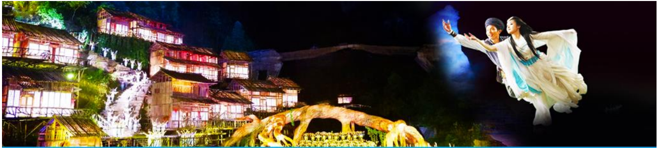
The Love Story of a Wooden Man and Fairy fox

จากนั้นท่านสามารถทดสอบกำลังขาของท่าน โดยการเดินลงบันได 999 ขั้น เพื่อลงมายังลานกว้างที่เป็นจุดถ่ายรูปล้านล่างของประตูสวรรค์ ท่านที่ไม่ต้องการเดินบันไดลง สามารถใช้บันไดเลื่อนแทนการเดินลงบันได 999 ขั้น ณ ลานกว้างด้านล่างเป็นจุดถ่ายรูปที่ดีที่สุดที่สามารถมองเห็นเขาประตูสวรรค์ได้อย่างชัดเจน จากนั้นนำท่านนั่งกระเช้าลงจากเขาเทียนเหมินซาน