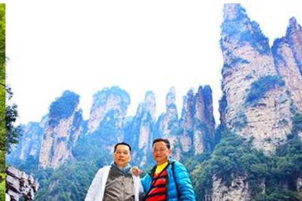
ชมจุดชมวิวลีฟท์แก้ว