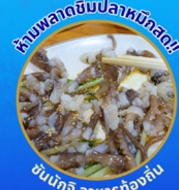
ทานพลาตซิมปลาหมึกสด!

โพล้งสเปซวอล์ค สกายวอร์ค ตามรอยซีรีส์ Hometown chachacha ถ่ายรูปชิคๆ หมู่บ้านวัฒนธรรมคัมซอน ขึ้นเคเบิลคาร์ ชมทะเลปูซาน นั่งรถไฟปู๊กปิ๊ก sky capsule ชิมของอร่อยตลาดแฮนแด อิสระช้อปปิ้ง Lotte Duty Free