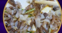
ซันนั๊กจิ อาหารท้องถิ่น