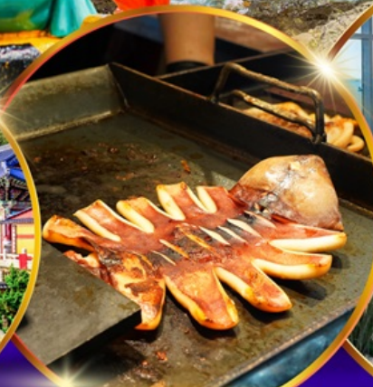
ตลาดแฮอุนแด