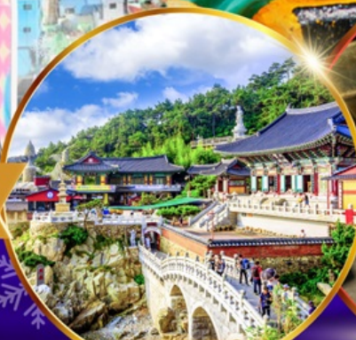
วัดแฮดงยงกุงซา