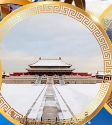
พระราชวังต้องห้าม