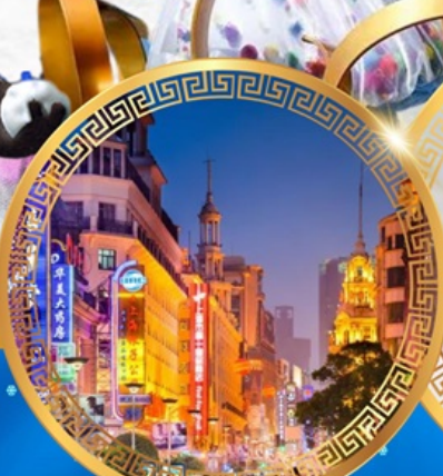
ถนนคนเดินหนานจิง