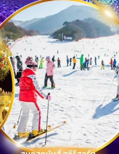
สกีรีสอร์ท

ชมจอ LED ขนาดยักษ์ที่รีสอร์ท 5 ดาว ใหญ่ที่สุดในเอเชียเหนือ สัมพัสมะสกีรีสอร์ท สกีรีสอร์ท สวนสนุกเอเวอร์แลนด์ ชมพระราชวังคยองบกกุง ย้อนอดีตหมู่บ้านบุกซอน ฮันอก อิสระช้อปปิ้งคังนัม Lotte Duty Free