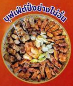
บุฟเฟต์ปิ้งย่างไม่อั้น