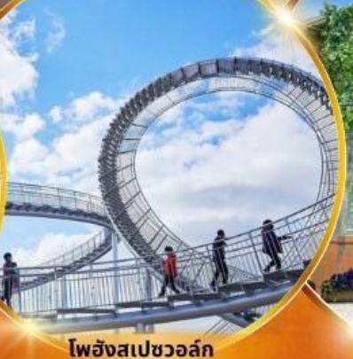
โพฮังสเปซวอล์ค