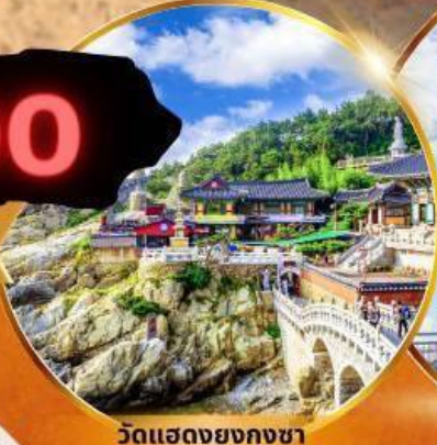
วัดแฮดงยงกุงซา