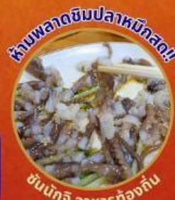
ห้ามพลาดชิมปลาหมึกสด!!