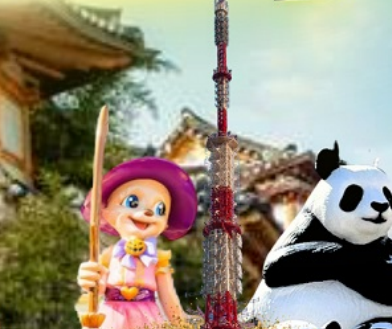
N Seoul Tower