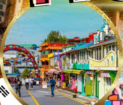
หมู่บ้านเทพนิยาย