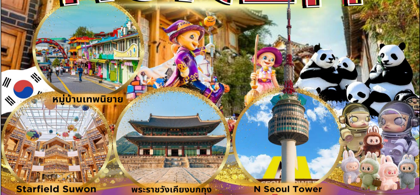
หมู่บ้านเทพนิยาย