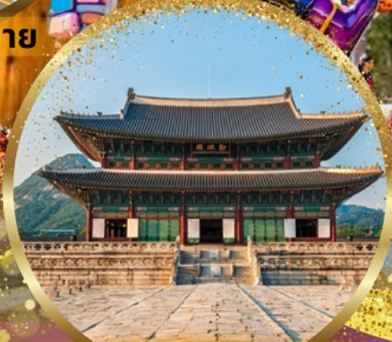
พระราชวังเคียงบกกุง

EASTAR JET เดินทาง อิสตาร์항공 กันยายน 2567